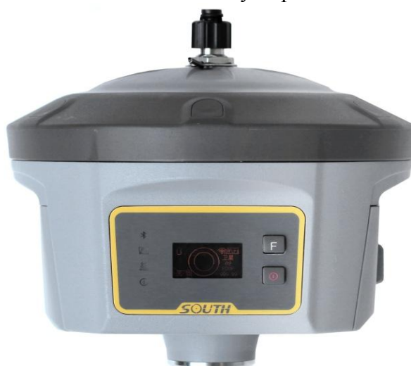
Рисунок 1 - Общий вид приемника

Общий вид приемников приведен на рисунке 1. Внешний вид приемников со стороны нижней панели с указанием места нанесения знака утверждения типа приведен на рисунке 2.